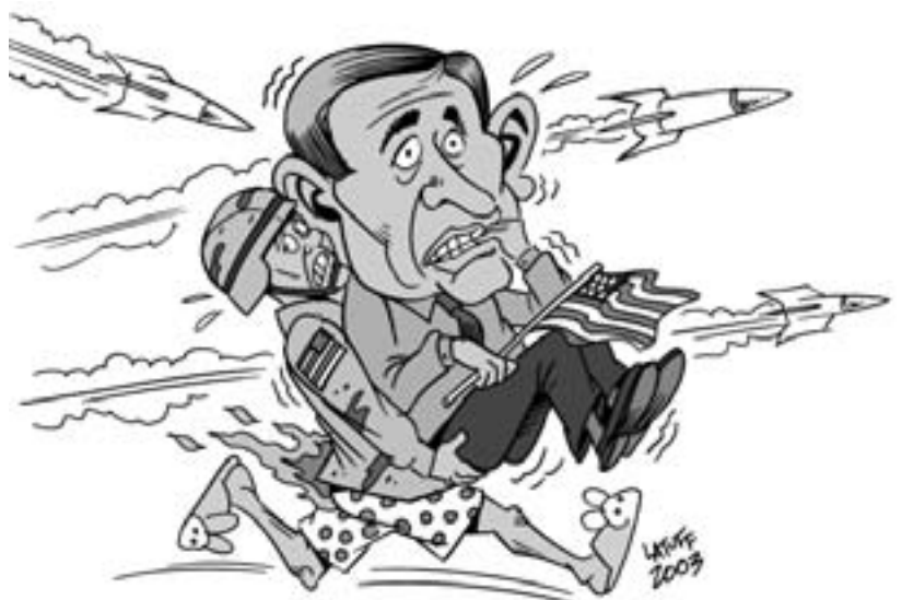
Hilsen til Wolfowitz