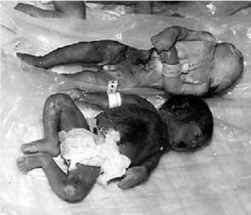
Ofre for forarmet uran fra den første golffkrig. Wesley Clark brugte det flittigt under krigen mod Jugoslavien. Det blev også igen brugt mod Irak i år.

overensstemmelse med de proklamerede mål. Andre registrerede en hyklerisk militær operation, der tog sigte på at sikre sig kontrol med Balkans olieruter og landets markeder og samtidig eliminere arbejdernes selvforvaltning og de sociale goder i forbindelse med "jugoslavisk socialisme".