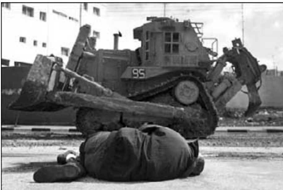
Mordet på Rachel Corrie

- Et hvidt flag er det internationalt mest kendte symbol på fred og overgi-