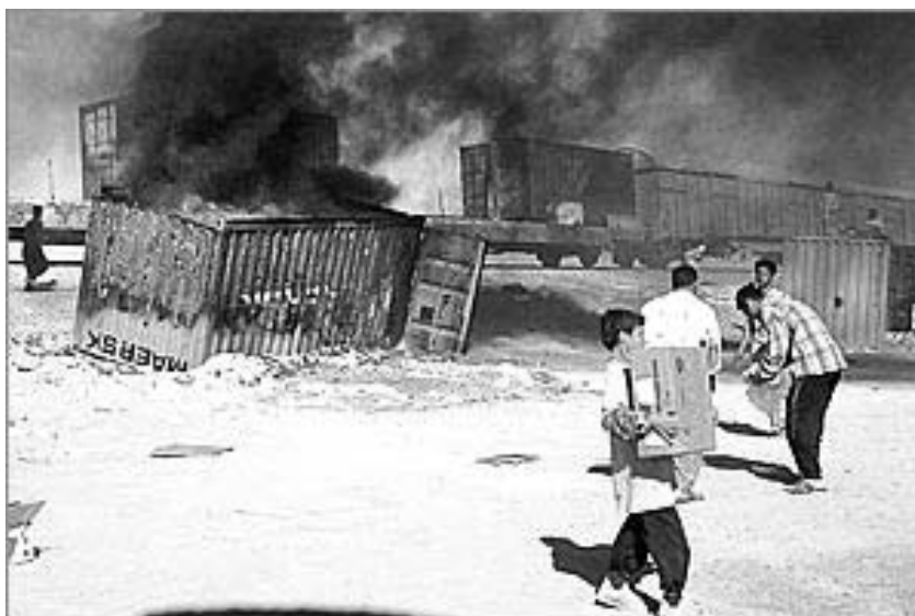
Brændende Maersk tog ved Falluja

Angrebet i Falluja på Maersk-transporten var blot et af de talrige optrappede angreb på besættelsesmagten og irakiske kollaboratører. Det amerikanske tabstal i 'genopbygningsperioden' overstiger nu antallet af dræbte soldater under selve krigen. Derudover er der dræbte og sårede soldater fra de fleste af de lande, der sendte soldater til Irak til krigen eller til den fortsatte besættelse.