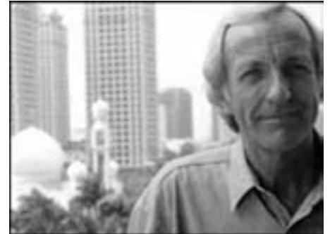
Den australsk-britiske journalist John Pilger har lavet en fremragende dokumentar om USAs terrorkrig: Breaking the silence