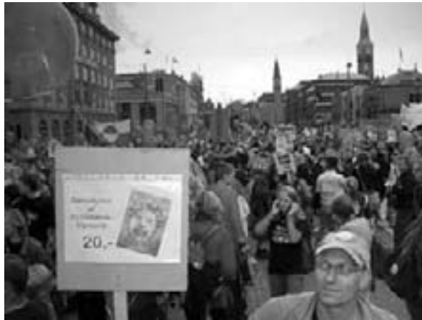
Folkeoptøget for Christiania 30. august: Protesterne er begyndt

Den hårdeste besparelse falder på sygehusvæsenet, hvor der skal spares en kvart milliard kroner. Overborgmesteren har sammen med forligspartier fundet en snedig formel frem, der skal dæmme op for modstanden. Besparelsen er endnu ikke omsat til realiteter. Det angives ikke, hvor og hvilke hospi-