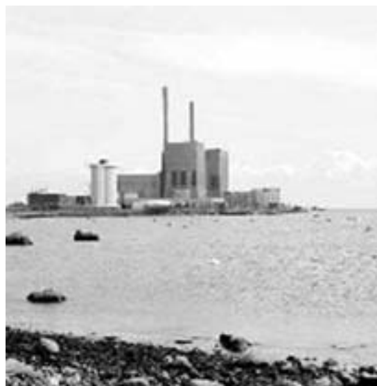
Barsebäck - verdens dårligst placerede A-kraft værk

I modsætning til Tjernoby-kernekraftværket, der ligger i et tyndt befolket landbrugsområde, er Barsebäckværket placeret i det tættest befolkede område i Skandinavien, mindre end 30 km fra den største by i Danmark og den tredje største by i Sverige. I den danske hovedstad bor der mere end 660.000 mennesker [1,4 mio. i StorKbh., red.]. Det er derfor sandsynligt, at langt flere end de 350.000 personer, der blev evakueret eller genhuset efter Tjernobykatakstrofen, vil skulle evakueres eller genhuses i Danmark, såfremt den værst tænkelige