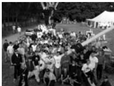
Fra TiB's sommertræf på Sletten

- Ved at regulere SU'en lavere forringer man studerendes købekraft og sparer penge den vej. Samtidig vil man beskære produktionsskolerne og gøre den offentlige transport dyrere, siger