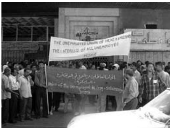
Arbejdsløse demonstrerer. Hundretusinder af irakere har mistet deres job som følge af krigen og besættelsen.