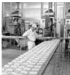
Daloon fyrer en fjerdedel i Nyborg og Rudkøbing.

Det er specielt i den private sektor, at jobbene forsvinder. Således tegnede den private sektor sig for 80 pct. af reduktionen for 2. kvartal 2003.