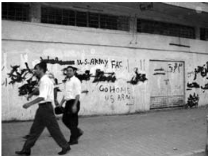
Væggrafitti imod amerikanerne: "Go home, US army!"

Oversættelsen af interviewet "Six semaines à Bagdad sous l'occupation" og Billedreportagen er lavet af Michael Jensen fra Solidaire, nr. 29, 20. august 2003.