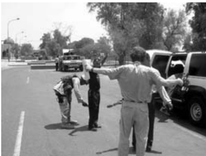
Ved check-points kontrolleres alle personer, der nærmer sig besættelsesmagtens bygninger

De amerikanske soldater er arrogante. De irakere, der var neutrale eller lidt positive over for amerikanerne, fordi de væltede Saddam, ved nu, at amerikanerne ikke kom til Irak for at hjælpe dem. I Bagdads Internationale Lufthavn holdes tusinder af mennesker i fangenskab. Enhver "mistænkelig" person arresteres eller nedskydes ganske enkelt uden varsel. Jeg tog en dag ud for at se til en 10-årig dreng, der var blevet beskudt fra en kontrolpost. Hans skulder hang i laser, og nu er han handicappet for resten af livet. Men denne dreng havde intet sted at gå hen. Det amerikanske militærpoliti, der angiveligt skal overvåge hærens overgreb, løf-