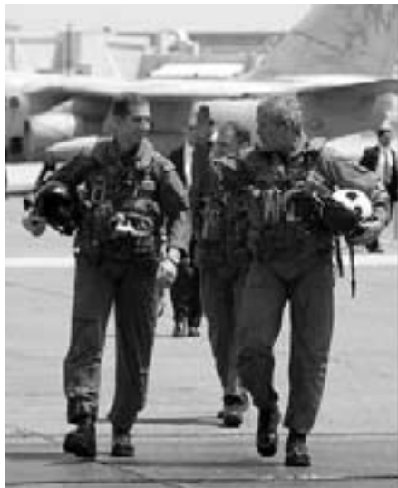
Bush ankommer i fuldt militærdress til USS Abraham Lincoln 1. maj

gennemfører stadig kamphandlinger. Det er en anden slags kampmission, men det er alligevel aktiv kamp, bare spørg drengene derovre, som dræber og bliver beskudt."