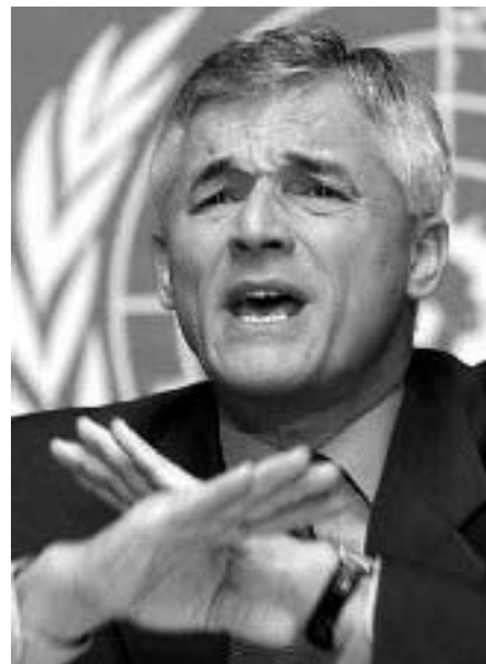
Sergio de Mello, FN-chefen i Bagdad var blandt de omkomne ved bombningen af FN-hovedkvarteret

Dette er selvfølgelig ikke noget, som disse amerikanske lakajregeringer praler med – og dog. Polens udenrigsminister Włodzimierz Cimoszewicz sagde i modsætning til vores hjemlige super-