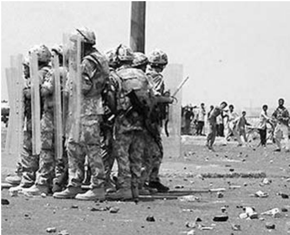
Britiske soldater i kampe mod irakere i Basra

Mens den strikke af løgn og bedrag, som Bush og hans bande (inkl. Tony Blair) har stukket hovederne ind i, strammes mere og mere om deres egne halse, er det ynkeligt at se deres små kloner i den danske regering lancere deres eget lille Irak-krigsspil midt i den danske hovedstad.