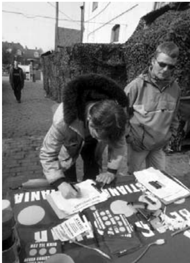
Underskrift indsamling på Christiania

V i skal bare selv til at tænke over, hvem vi VIRKELIG tør lade os repræsentere af. Sim- pelthen seriøse, kreative mennesker vi stoler på. Jeg kan komme i tanker om masser af herlige men- nesker i Danmark, jeg med en del mere sindsro turde lade repræsentere os (hvis vi alle sammen selv fulgte godt med og blandede os, når det var nødvendigt). Og så tage del i tingene selv, så de