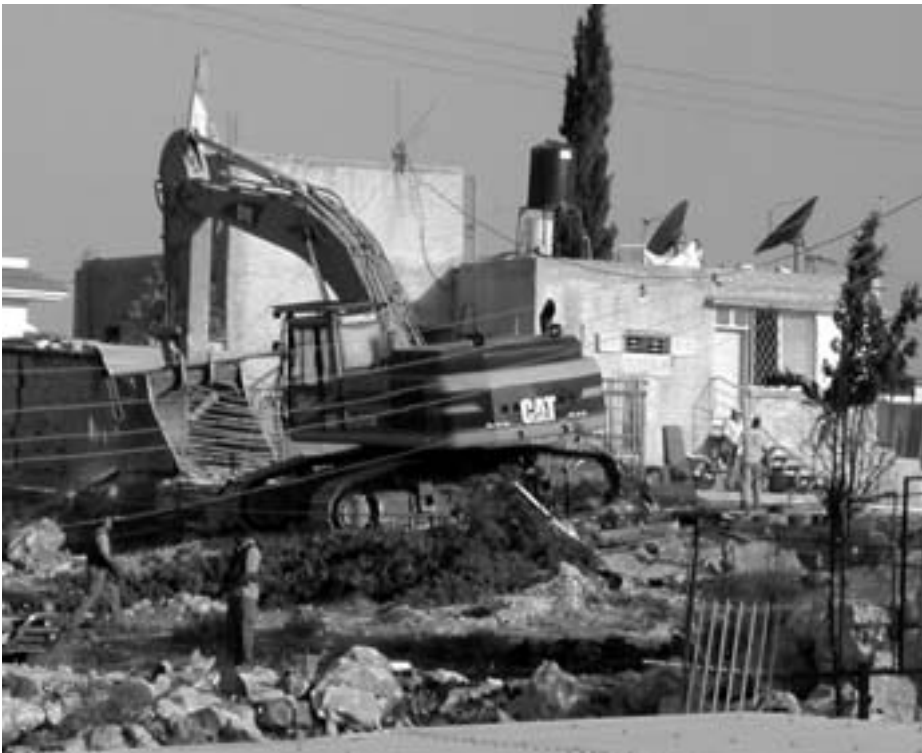
Israelsk bulldozer nedriver familiens stald

Alligevel fortsatte protesten ved familien A'ameers hus. Næste dag blev mere end 20 israelske aktivister hårdhændet fjernet og arresteret samme sted.