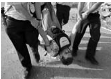
Israelsk fredsvagt anholdes den følgende dag ved ny protest ved A'amer-familiens hus

- Sharon-regeringen løslod mere end 300 af os i denne uge, men han glemte at fortælle, at besættelsestropene havde arresteret mere end 300 andre af os i juli måned, den første måned af hans såkaldte 'fred' med palæstinenserne. Nu er nogle af os blevet sendt hjem til Qalqilya, et kæmpe-fængsel beboet af 40.000 palæstinensere.