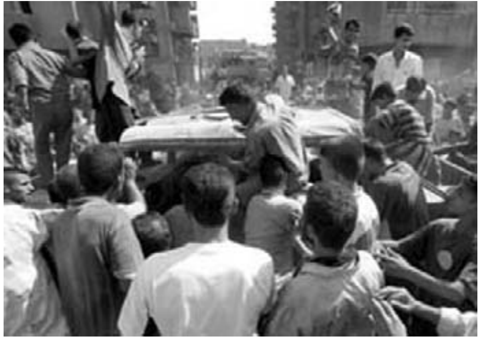
Irakere ved et ødelagt amerikansk militærkøretøj i Bagdad

Under folketingsdebatten 19. marts, ved førstebehandlingen af beslutningsforslaget om dansk krigsdeltagelse, erklærede den nuværende udenrigsminister bl.a.: