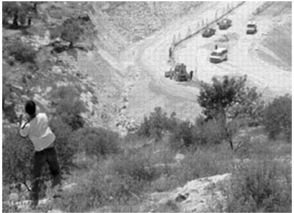
Palæstinensisk dreng kaster sten mod israelere der bygger apartheid muren