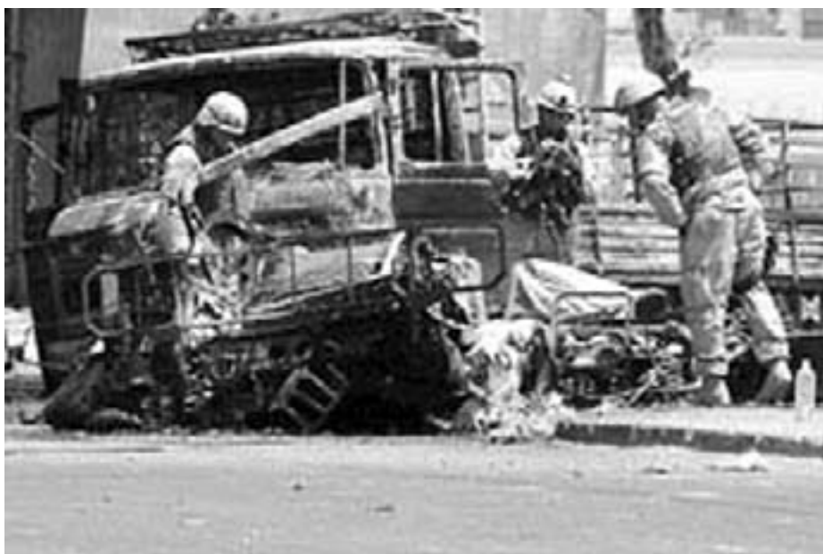
Amerikanske soldater undersøger vraket af et amerikansk militærkøretøj

det er jo at sige: Det er jer, der skal træffe beslutningen, det er det, I er valgt til, og vi er indstillet på af hensyn til den internationale orden at følge op, så vidt vi kan, fysisk og økonomisk, på de opgaver, Sikkerhedsrådet beder os om at udføre. Vi er jo også meget med i FN's opgavevaretagelse både militært og humanitært. Så jeg synes ærlig talt, at det er meget klart, at det er Sikkerhedsrådet, der afgør, om (Resolution) 1441 er nok. Det er det, der menes med "forankret i FN".