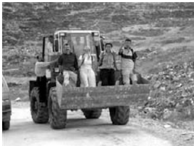
Fredsvagter fra International Solidarity Movement ved protesterne der førte til udvisningen af 8 fredsvagter

Senere forsøgte 40 palæstinensere og syv internationale fredsvagter i Deir Al Ghassoon at trænge gennem en åbning i muren for at komme til palæstinenserens jord på den anden side for at så afgrøder.