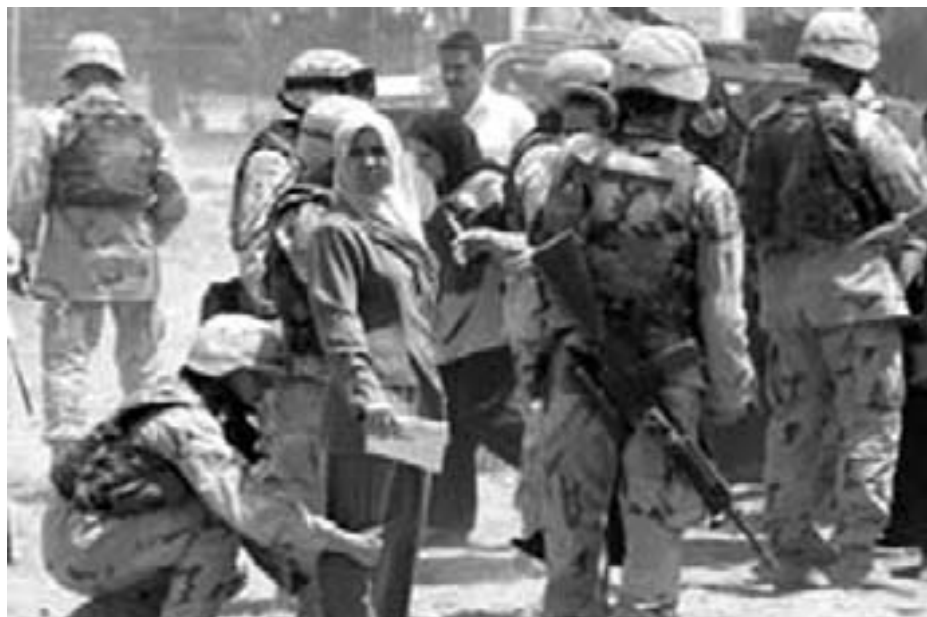
Kvindelig amerikansk soldat kropsvisiterer studine - Bagdad Universitet

Socialdemokraterne stemte for danske besættelsestropper.