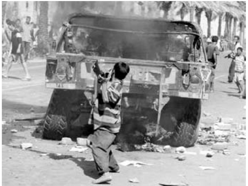
Irakisk dreng kaster sten mod brændende amerikansk køretøj - Bagdad

Både Fogh og Møller begrundede ved krigsstarten deres deltagelse med Saddams ikke-eksisterende masseødelæggelsesvåben. Ved folketingets afslutningsdebat den 3. juni (da ingen masseødelæggelsesvåben var fundet, men