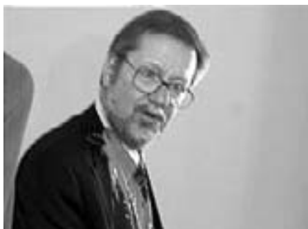
Per Stig Møller - blodig krigsforbryder og kodyl løgnhals

Den danske regering er langt om længe blevet sat under pres i forbindelse med dens begrundelser for at deltage i den folkeretsstridige krig mod Irak.