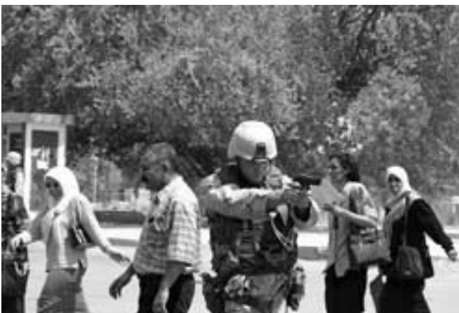
Amerikansk soldat truer studerende ved Bagdads Universitet med pistol

Hans Blix havde derimod på intet tidspunkt, hverken i sine rapporter eller på tv bekræftet, at Saddam Hussein besad masseødelæggelsesvåben. Udenrigsministerens udsagn kan kaldes 'overfortolkning'. Det kan kaldes 'misbrug'. Det kan også kaldes løgn på løgn