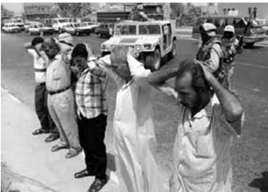
Amerikanske soldater kropsvisiterer irakiske bilister nord for Bagdad

Det fik Hans Blix til at reagere: Den danske regering overfortolkede, ligesom USA og Storbritannien, rapporterne fra FN's våbeninspektører op til krigen mod Irak, sagde han til Politiken den 14. juli. Han kritiserer her den sammenhæng, som udenrigsminister Per Stig Møller har brugt hans rapporter i over for Folketinget op til beslutningen om at sende danske soldater i krig