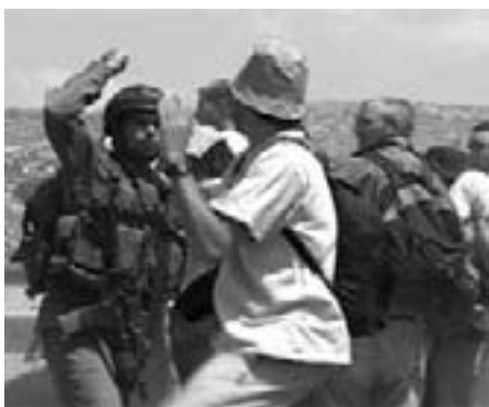
Fredsvagter bliver angrebet af israelske soldater under en protest mod apartheid muren

Vestbredden er gennemkrydset af bosætterveje, hvor kun biler med israelske nummerplader har ret til at køre. Disse veje forbinder de ulovlige* israelske bosættelser. Mange steder krydses bosættervejen af palæstinensiske veje, og her er der enten af det israelske militær bemandede checkpoints eller udlagt roadblocks i form af betonblokke eller jordvolde, som helt forhindrer palæstinenserne i at køre igennem. Checkpoints og roadblocks gør livet nærmest umuligt for palæstinenserne, specielt i landområderne, hvor adgangsvejene mellem landsbyerne er få.