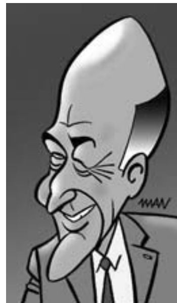
Konventspræsident Valéry Giscard d'Estaing - i venlig streg

"EU er det nye Europas store demokratiske forum, hvor mennesker og synspunkter mødes til alles fordel. Hvis man har været i tvivl tidligere, kan man ikke være det længere. I virkelighedens verden er der ikke noget alternativ til EU."