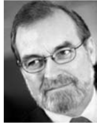
Fagligt forsvar savnes

- Det har vist sig, at man rent statistisk ikke kan gå mange år tilbage for at