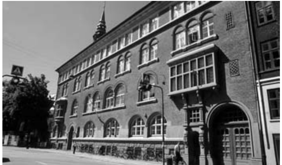
TDC: Fyrer 1650 medarbejdere

Bedre ser det ikke ud inden for serviceerhvervene, hvor forventningerne