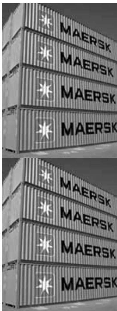
Model af operahuset