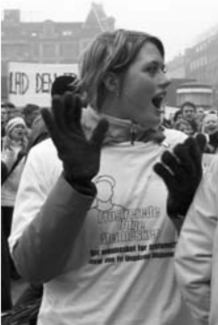
Fogh og Co. fortsætter amokløbet mod både unge og gamle

Borgerskabets offensiv mod arbejderklassen og Underdanmark har taget et hidtil uset aggressivt og voldsomt omfang og tempo