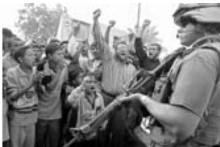
Irakisk protest mod besættelsen

Hvis det virkelig var hjælp til den irakiske befolkning der stod på programmet, burde man give irakiske firmaer de store genopbygningsordrer og genåbne de irakiske skoler, der alle for