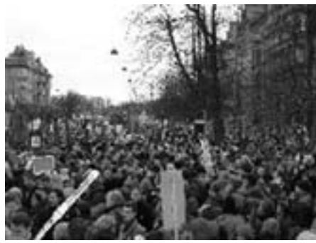
15. februar 2003 Største demonstration nogensinde foran den amerikanske ambassade på den globale aktionsdag. En ny verdensbevægelse manifesterede sig.