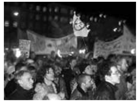
Krigsudbruddet 20. marts 2003 Demonstrationer i 31 danske byer Her Rådhuspladsen i Århus