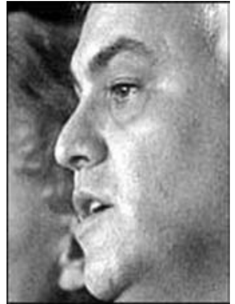
Richard Perle - "Mørkets Fyrste"

Richard Perle har erklæret, at USA's kampagne i Irak understreger hans argument, at demokratier ikke starter aggressive krige. "Diktaturer starter krige, fordi de har brug for eksterne fjender for at udøve intern kontrol over deres eget folk." Hvis man dertil lægger behovet for at øge markedet for våbeneksport, multinationale virksomheder og banker – og for olie – nærmer vi os måske sandheden om, hvorfor USA startede Irak-krigen og konstant går i krig.