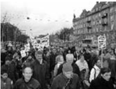
16. oktober 2002 'Ingen krig mod Irak': International aktionsdag Demonstration og fredskoncert

Konferencen drøftede også fremtidige aktioner og initiativer og bekræftede, at 'Nej til krig' er en del af den globale antikrigsbevægelse. Det blev blandt andet understreget ved at initiativet tilsluttede sig European Social Forum (ESF).