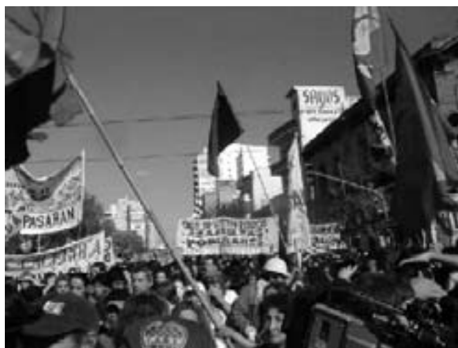
1. maj i det kriseramte Argentina