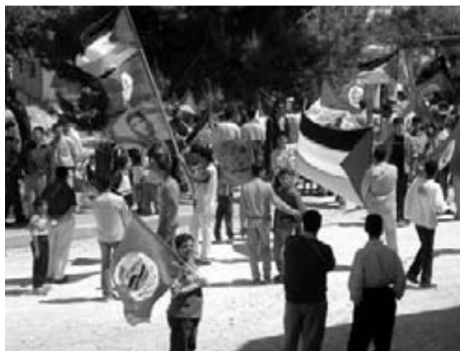
Majdagen blev markeret i mange byer i det besatte Palæstina