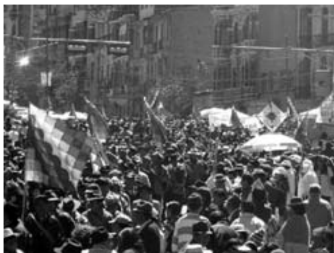
Bolivia: 100.000 deltog i kæmpedemonstration i La Paz