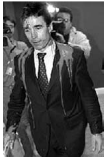
Fogh i Folketinget 18. marts

skal det skete forstås sådan, at retspraksis også herhjemme nu er, at man de facto kan idømmes 2½ måneds fængsel uden retssag? At der opereres med politiske domme, hvor de anklagedes retssikkerhed er ophævet? At der gælder én lov, når sagen inkluderer personer med offentligt hverv, hvis deres titel er minister - og en anden lov, hvis de har