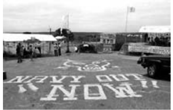
Vieques, Puerto Rico: 1. maj fejrede puertoricannerne at den amerikanske flåde har måttet fortrække fra Vieques efter 6 årtier - og årtiers protester

Der er fællestræk mellem Thule og Vieques. De er begge blevet forladt af én eneste grund: De er ikke længere helt nødvendige for den globale amerikanske strategi. USA søger at sikre sig global militær dominans og har rykket sin opmærksomhed imod andre områder, mod nye besættelser og mod ny kolonisering. Begge steder efterlader amerikanerne en miljøkatastrofe, en langtidsvirkende giftlosseplads i følsomme økologiske zoner – og begge steder efterlader amerikanerne oprydningssarbejdet og regningen til de indfødte. Og begge steder er det kun de mest synlige beviser på amerikansk kontrol, der forsvinder. USA er stadig den dominerende magt i Puerto Rico og på Grønland –