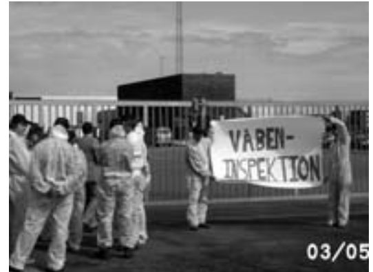
Inspektion ved Maersk containerterminal

- Glædeligvis faldt Saddam Husseins styre hurtigt, og der koncentrerer nu om