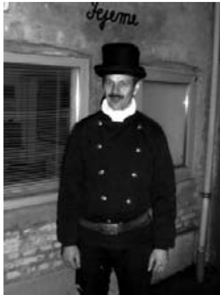
Stadig mere sort arbejde

Problemet er blot, at de samme to sygdomstræk er tiltagende i den vestlige kapitalistiske økonomi – ligesom de stadig er en kendsgerning i de "demokratiserede" samfund i øst.