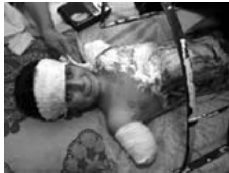
Et af de talløse civile ofre for 'befrielsen' af Bagdad

Det er for længst blevet afsløret, hvordan den globale transmitterede medieaktion tirsdag den 9. april, da Saddams statuen på Fardus-Pladsen blev væltet af amerikanske styrker og irakiske leje-