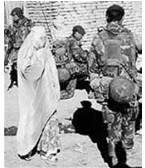
Britiske soldater og afghansk kvinde. De internationale styrker i Afghanistan er besættelsestropper. Danmark deltager også her.

* I mangt og meget er Afghanistan vendt tilbage til det kaos og det klandominerede samfund, hvor regionale krigsherrer har magten, som herskede før talibanernes magtovertagelse. En afgørende forskel er selvfølgelig tilste-