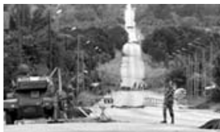
Reaktionær borgerkrig i Elfenbenskysten

• Indblanding fra nykolonialistiske magter under ledelse af Blaise Compaoré (præsident i Burkina Faso, o.a.) og Charles Taylor (præsident i Liberia, o.a.), der virker for den franske imperialism og for deres egne interesser ved