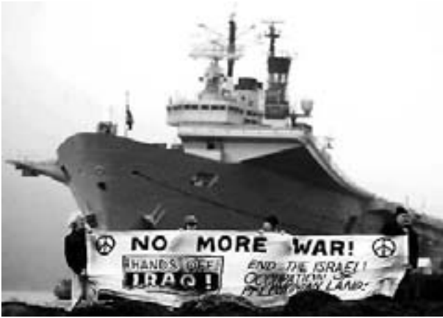
Protest i Skotland mod krigsskib.

Det er med blandede følelser, jeg står her i dag. Først og fremmest er jeg glad for indbydelsen til at bidrage med et relateret emne til krigen, og for det andet er den frygtede krig, vi havde håbet at undgå, og især med håb om uden dansk deltagelse, gået i gang. Den er begyndt, og den danske regering har valgt at deltage. Flere tusinde missiler og bomber har ramt Irak og de civile byer. Især Bagdad er blevet ramt hårdt. Civile, uskyldige mennesker lever en dagligdag fyldt med frygt for, at det kan blive deres sidste.