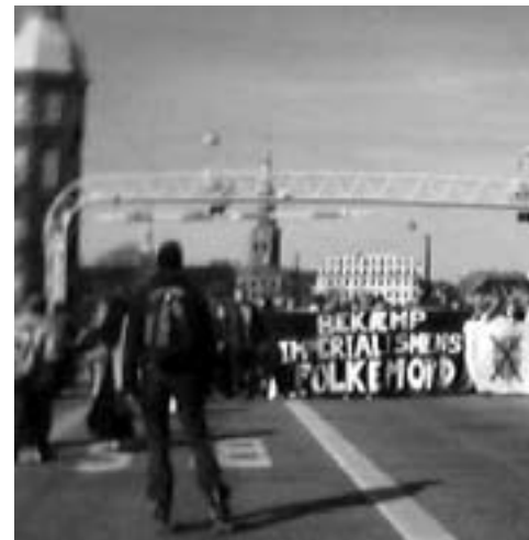
21. marts: Christiansborg beslutning