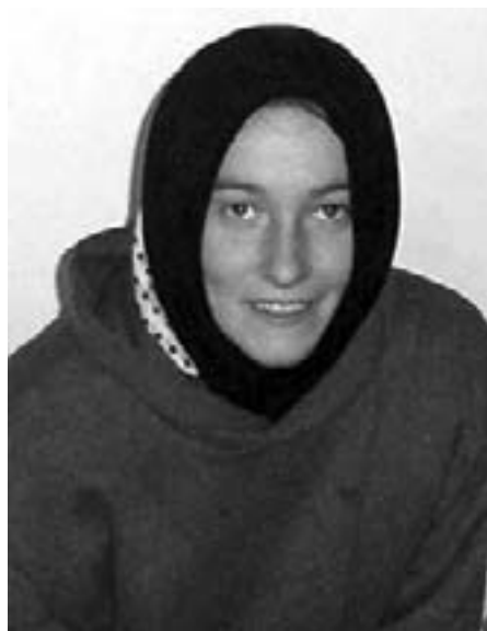
I mindet om Rachel Corrie