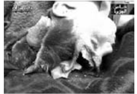
Dreng dræbt i Bazra 20.03.03

Juridiske eksperter i USA og Storbritannien har også erklæret krigen for ulovlig. I januar fastslog 325 lærere fra 87 juridiske fakulteter over hele USA, at en amerikansk krig, udløst uden godkendelse af FN's Sikkerhedsråd imod et land, der ikke har angrebet de Forenede Stater, i sig selv ville være en ulovlig