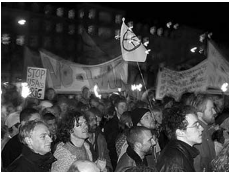
Tusinder protesterede i Århus ved krigsudbruddet da Fogh, Møller og Kjærsgaard sendte Danmark i krig på de arbejdendes regning.

Mens højreregeringen og Dansk Folkeparti mod befolkningens ønsker besluttede at sende Danmark i krig mod Irak på USA's side, blev de lovede skattelettelser til befolkningen samtidig i det store og hele forhandlet på plads. Skattelettelser til glæde for de velbærgede, mens de lavtlønnede arbejdere spises af med småører, og de svagest stillede på overførselsindkomster ikke får en krone.