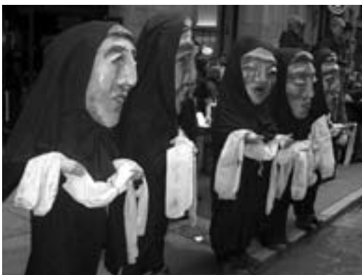
Sørgende irakiske mødre.

Andre dele af dansk kapital læner sig midt i krigens grusomheder mageligt tilbage i sikker forvisning om, at der er guld at spinde i forbindelse med en eventuel genopbygning af Irak. Parallelt med den internationale diskussion om indsættelse af et nyt politisk styre og en eventuel genopbygning af Irak føres der allerede nu en kamp for at få del i lunserne. Dansk kapital ser – efter at Danmark er trådt aktiv på banen som krigsførende part – muligheder for at komme til rovet. Mens den amerikanske og britiske kapital med garanti vil tage langt det største bytte, er der ingen tvivl om, at Danmark står højt på listen, når de resterende udbytter skal fordeles til de næste gribe. -gri