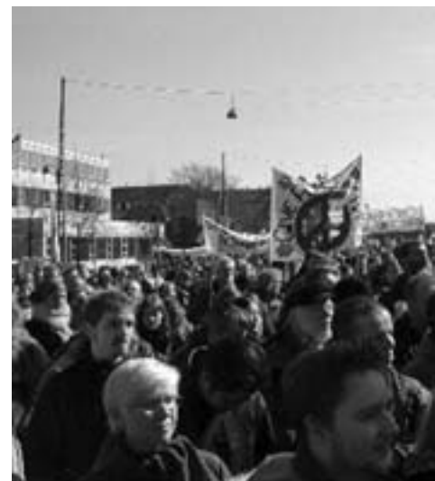
22. marts: Ved USA's ambassade. Protest