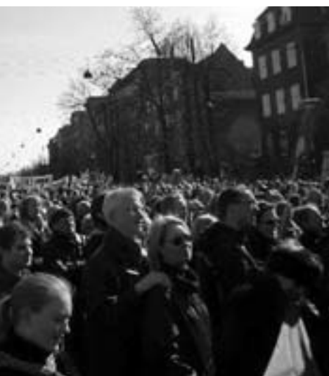
otester i København og landet rundt.