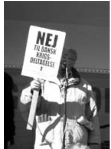
Anker Jørgensen 15. marts

Vi vil ikke indstille protesten og kampen, før alle amerikanske og allierede tropper er ude af Irak og af Mellemøsten og det irakiske og de arabiske folk og øvrige folk i regionen selv kan afgøre deres fremtid. Vi stiller os solidariske med det palæstinensiske folks berettigede kamp for en selvstæn-