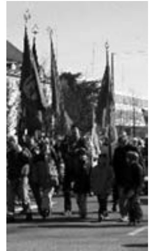
Fagforeningsfaner i spidsen for fredsmarch - men fagbevægelsen er ikke med.

I denne situation skulle man tro, at venstrekræfterne i fagbevægelsen kendte deres besøgstid. Den landsdækkende bevægelse Fagligt Ansvar , som efter Fogh-regeringens tiltrædelse kastede