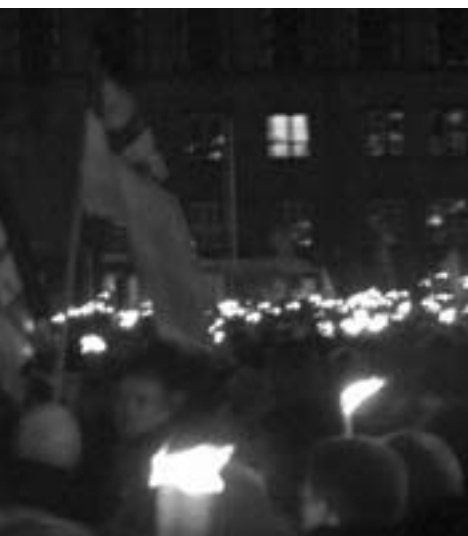
dsen Kbh og i 36 andre danske byer