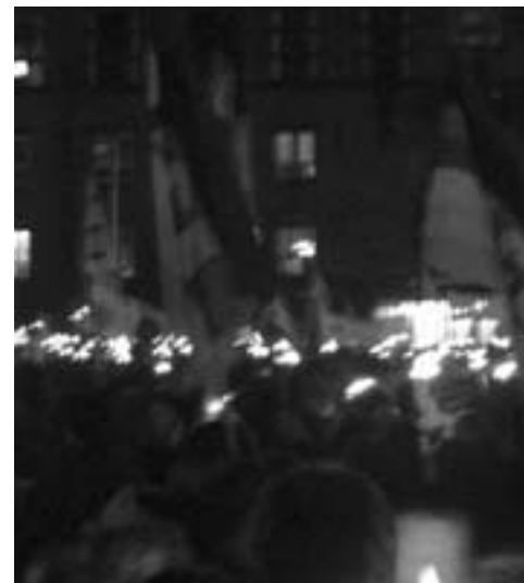
20. marts kl. 20: Protest, Rådhuspladsen