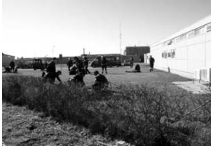
Anholdelser af fredsaktivister i Korsør under forsøget på at hindre krigsskib i at drage i krig.

for en krig mod Irak. Det er indlysende, at Irak ikke er en trussel mod USA eller dets integritet, men at det forholder sig lige omvendt: USA truer med og anvender militærmagt for at sætte sig i besiddelse af de irakiske olieletter og indsætte et lydregime i Bagdad.