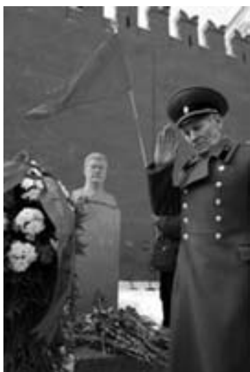
Stalin mindes i Rusland 5. marts