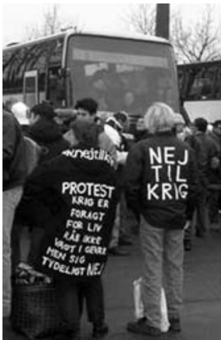
Antikrigsdemonstranter fra Odense ved afgang med busserne til København på den globale aktionsdag 15. februar