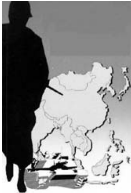
Oprustning, sociale nedskæringer - og krig mod de arbejdende. Bush's og Fogh's recept for krisen.

Privatforbruget var svagt i de sidste to måneder af år 2002. Julehandelen kunne ikke opveje et samlet fald i detailomsætningen på 2,3 pct. Oveni