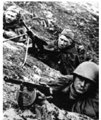
Russiske soldater ved Stalingrad

Læserbrev i den britiske avis The Guardian