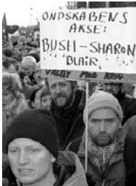
Bush - Sharon - Blair Der mangler et par navne: Pia, Fogh og Kjær

Højre regeringen mener det alvorligt, når man hævder, at bistandshjælpen er for høj. At folk, som er tvunget til at leve på overførselsindkomst i dagens