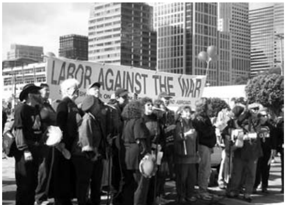
Der forberedes arbejdspladsprotester og strejker i mange lande, hvis USA udløser krigen. Her amerikanske arbejdere fra USLAW.

Det, vi står over for, er at gennemføre indholdet i den virkelige "freds-pligt": aktiv kamp mod krigen.