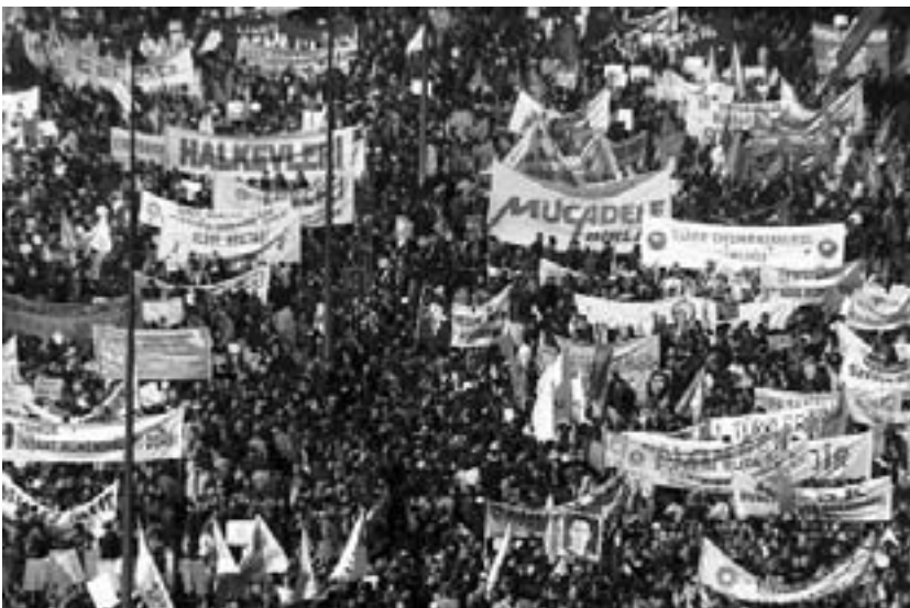
Billeder fra demonstrationen i Ankara