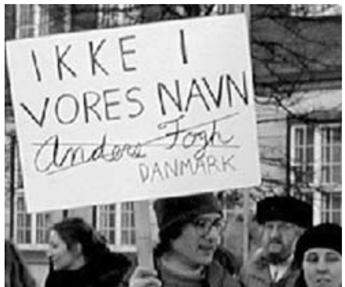
Budskab ved Christiansborg

Det var, hvad der skete. I København foran den amerikanske ambassade og med marchen til Christiansborg. Og samtidig overalt i verden.