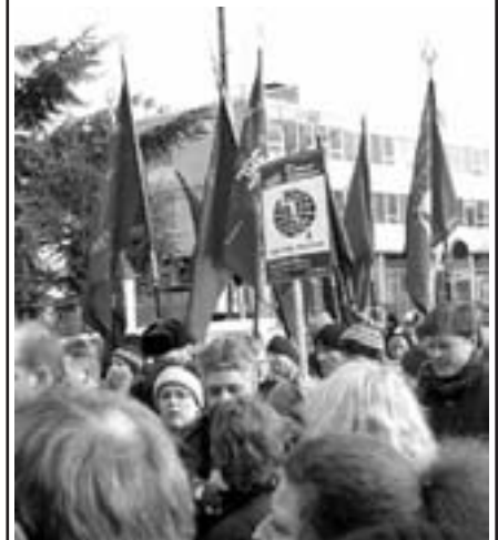
Fagforeningsfaner 15. februar

www.labournet.dk - (Faglig hjemmeside Mod Krig under opbygning).