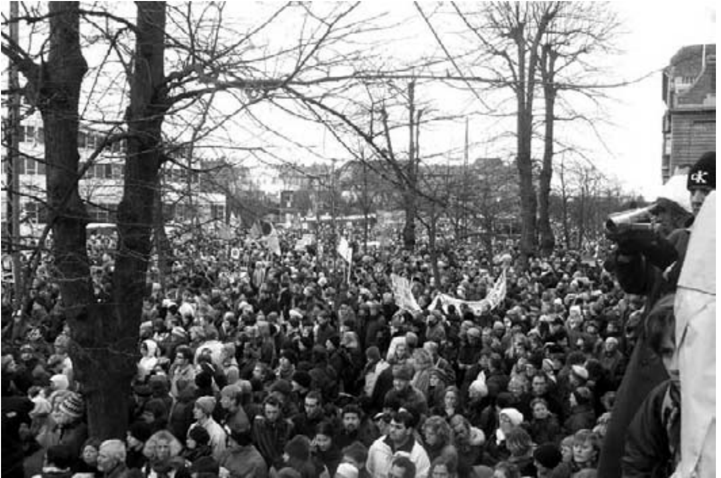
Største demonstration nogensinde ved den amerikanske ambassade: AFVÆBN USA

den! Goddag Busan, Dili, Edmonton, Foster! Goddag Geelong, Gislaved og Gävle! Goddag Hjørring, Hobart, Jaén, Kigali, Lahore, Launceston, Lismore og Lleida! Goddag Newcastle i Australien! Goddag San Juan!