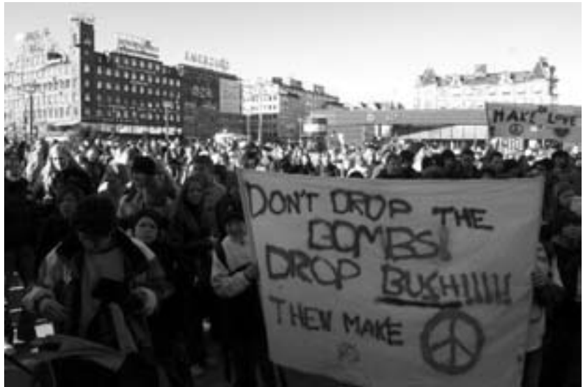
Københavnske skoleelever mod krig: Rådhuspladsen 20.02.03

1.000-1.500 elever fra de ældste klasser i 20 københavnske folkeskoler nedlagde undervisningen for at protestere mod Irak-krig den 20. februar. Klokken 12 gik demonstrationen i gang på