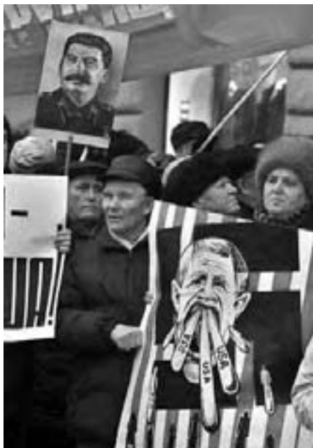
Fra demonstration mod Irak-krig ved den amerikanske ambassade i Moskva

Men russerne vil have navnet Stalingrad tilbage. Lokalparlamentet i Volgograd har besluttet det. Det blev fremført massivt af veteranerne fra krigen under fejringen af 60-årsdagen for sej-