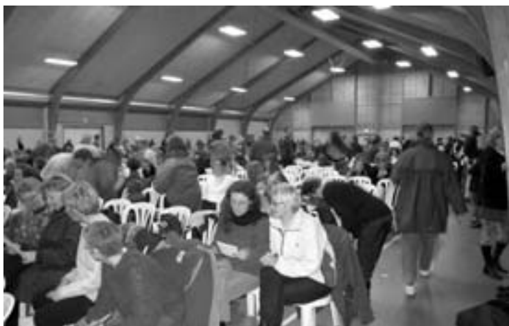
Fra pædagogstrejken i Odense mod Ny Løn november 2002.

Indførelsen af Ny Løn har været en ren katastrofe for de kommunalt ansatte, men omvendt en succes for de offentlige arbejdsgivere. Den gennemsnitlige løn er næsten ikke steget sidste år - kun 1,3 pct. - og de minimale lønstigninger er totalt blevet undergravet af inflationen. Nettoresultatet er et kraftigt reallønsfald.