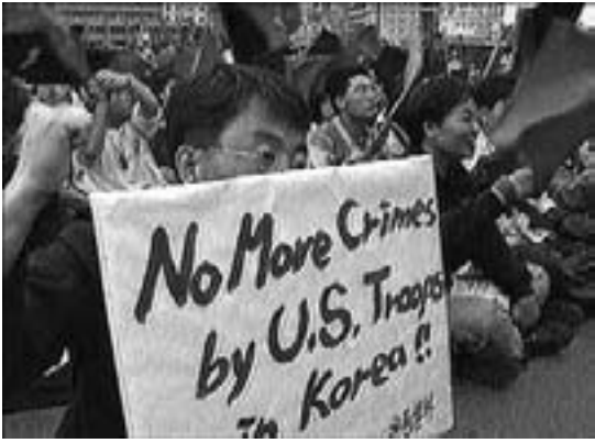
Ikke flere forbrydelser fra US soldater i Korea!

ske militærbudget tårner sig op på 14,5 pct. af det samlede statsbudget.