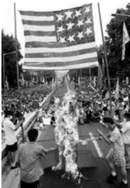
Afbrænding af amerikansk flag i Seoul

forgangne år en meningsmåling blandt sydkoreanerne om deres holdning til USA; den var negativ for mellem halvdelens og tre fjerdedeles vedkommende - afhængigt af aldersgruppen, med ungdommen som de mest USA-fjendtlige. Et andet amerikansk institut, Pew Research Center, har i Sydkorea undersøgt holdningen til USA's såkaldte krig mod terror og fundet, at 72 pct. er imod terrorkrigen, 24 pct. støtter den. Det tal bekræftes af, at 73 pct. i undersøgelsen mener, at USA ikke tager nogen hensyn til andre landes interesser overhovedet. Flertallet erklærer i gentagne meningsmålinger, at de frygter USA, ikke landsmændene i nord, som de tværtom agter at blive genforenet med - uden USA's indblanding.