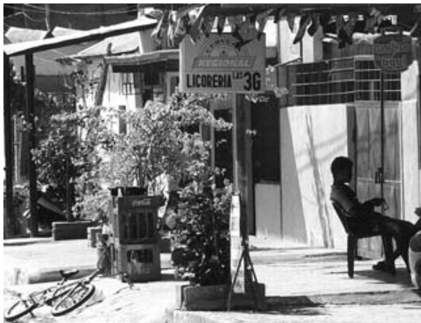
Afslapning - Venezuela style

Det var en uddannelsesby, med et stort universitet, hvorpå der gik 40.000 studerende. Dette betød at byen var fyldt med unge mennesker fra hele landet, og det nærliggende land Colombia. Så vi fik snakket med en masse spændende folk og hørt mange gode historier!