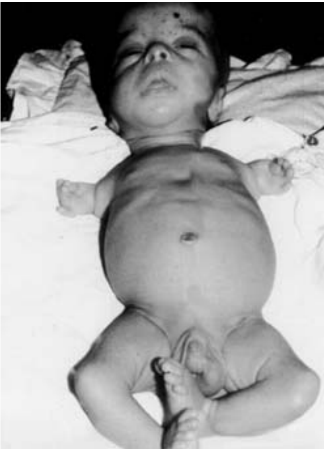
I både USA og Irak betaler børnene den højeste pris for krigen. USAs brug af forarmet uran betyder deformiteter og sygdom.

våben, sandsynligvis i de allerførste dage af det kommende angreb.