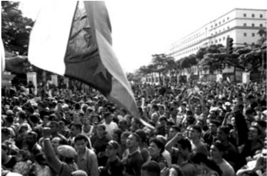
En af mange pro Chavez demonstrationer i Venezuelas hovedstad Caracas

vi ikke rigtig noget til nogle butikker der var skaffe alt hvad vi skulle og rimelig tydeligt fra en interesse i at få vælg også i strejken mod ske virksomheder og ra strejkedag nr.1.