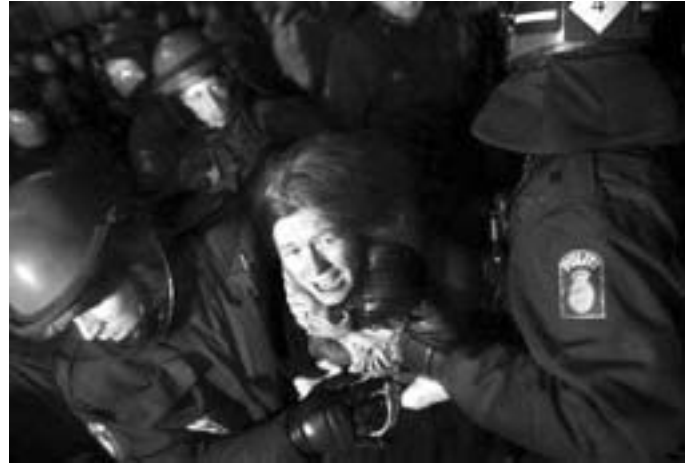
Politichikane. Hundreder blev holdt op for "ulovlig båbenbesiddelse" og kropsvisiteret uden gevinst.

inderste lag, betjenten tjekkede om mine lommer i bukserne nu også var tømt helt, jeg fik udleveret et tyndt tæppe, et æble og en halv liter vand, og så var det ellers ind i detentionen og vente. De andre piger, jeg sad sammen med, var også sigtet for hærværk, dog