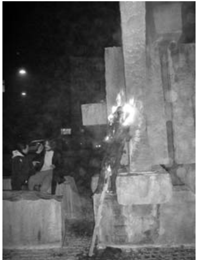
Faklen brænder ned - den sidste rest af menneskelighed i arbejdsløsdsløvgivningen forsvinder, mens lyset slukkes for den classesamarbejdende socialdemokratiske fagbevægelse.

Med de nye oplysningers fremkomst kan man spørge, hvad reformen ellers gemmer.