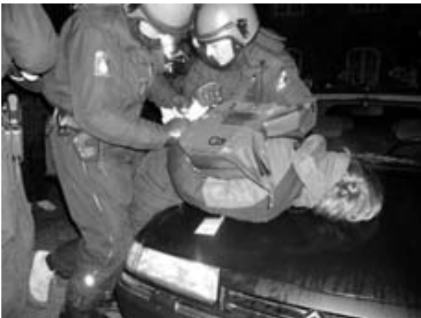
Brutal anholdelse af pressefotograf der skriger af smerte.

Natten mellem torsdag og fredag går en gruppe på ca. 30 italienere på Nørrebro. De er netop ankommet til København for at deltage i protesterne mod EU-topmødet. De bliver – som hundredvis af andre – stoppet af politiet med krav om at legitimere sig.