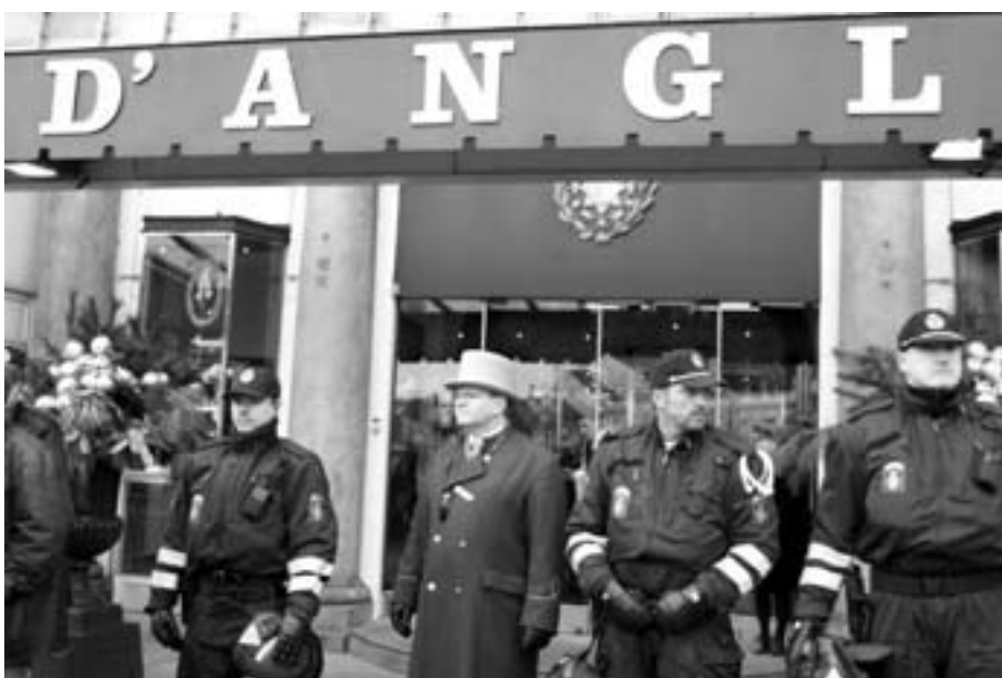
Borgerskabets lakajer med hat og kasketter venter foran D'Angleterre ved den internationale demonstration lørdag den 14. december. Voldsapparatet og tjenestefolkene på samme række.

Der var mange vigtige temaer for topmødeprotesterne. Det vigtigste spørgsmål lige nu er den krig, som den amerikanske imperialisme planlægger med støtte fra Tony Blair og Anders Foghs danske EU-formandskab. Kun en enkelt af demonstrationerne satte det i centrum og sagde nej til USA's terrorkrig, som EU har sluttet op om, til en ny krig mod Irak, som EU vil slutte op om, og til dansk og europæisk krigsdeltagelse. Det var København 2002s demonstration på Axeltorv fredag den 13. om eftermiddagen.