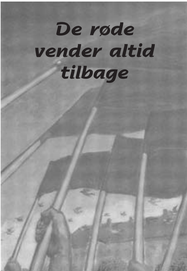
Joreningen Oktober Forlag