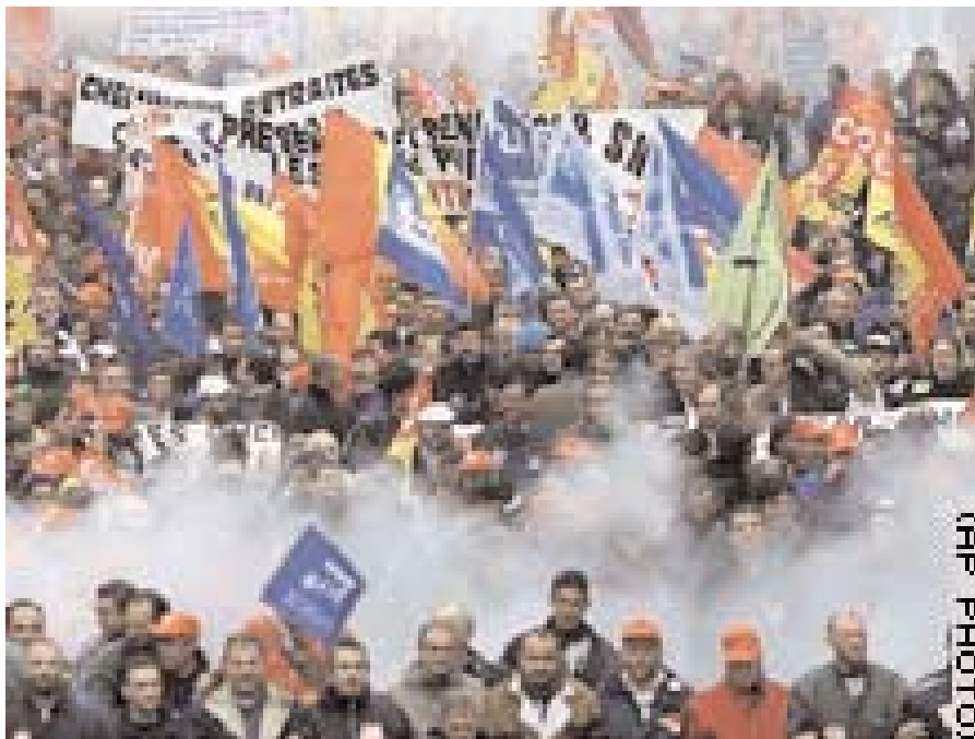
Arbejdskamp i Frankrig mod privatiseringer

Den europæiske Uni den superstat og en magt ved siden af USA. ter' kalder Giscard d'I