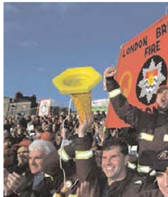
Britiske brandmænd s