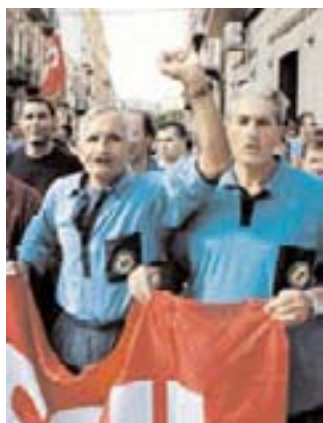
I Rom i Italien gik over 20.000 metalarbejdere i protestmarch mod truende fyringer fra bilkoncernen Fiat.