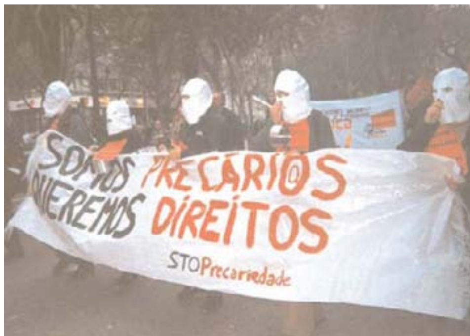
I Portugal gennemførte 500.000 offentligt ansatte en 24 timers strejke.