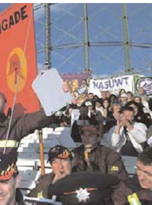
Strejker imod Blair.