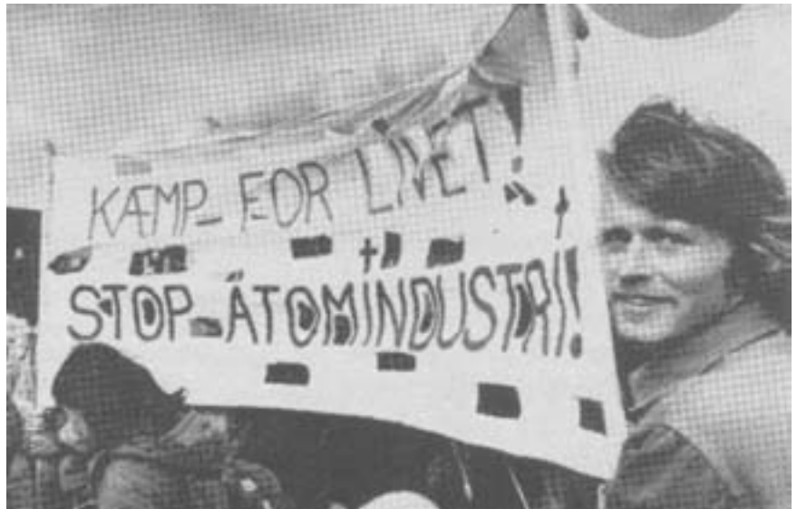
Barsebäckværket - ingen garanti for lukning. Den svenske atomlobby er fortsat stærk.

Så sent som d. 11. juni i år vedtog et flertal i Riksdagen efter forslag fra den svenske regering, at der blev indgået en frivillig aftale efter tysk forbillede med atomkraftindustrien om en langsigtet afvikling af atomkraften i Sverige. Ifølge erhvervsminister Björn Rosengren betyder det, at de eksisterende svenske atomreaktorer på trods af folkeafstemningen i 1980 vil fortsætte i drift 30-40 år endnu. Hertil