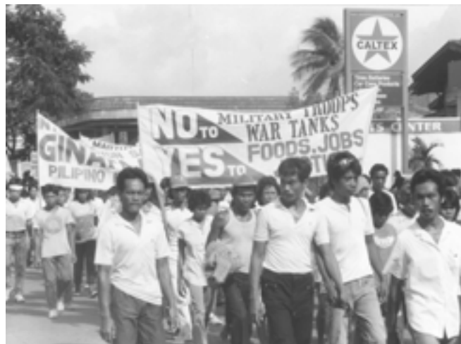
Filippinsk protestdemonstration mod amerikanske tropper.

Officielt er ASEM kommet i stand for at "forbedre relationerne mellem Asien og Europa". Men i virkeligheden er ASEM-møderne et forum for at fastholde de undertrykte nationer i et sla-