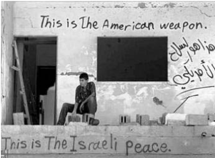
Dette er det amerikanske våben. Dette er den israelske fred.

Jeg tvivler på, at den israelske premierminister Ariel Sharon er løbet tør for ideer. Hver gang vi tror, at han har anvendt den allersidste mulige taktik i forsøget på at undertrykke det palæstinensiske folk, beviser den altid trodsige 'kriger' det modsatte. Hans seneste vilde jagt på palæstinensiske aktivister kostede palæstinenserne 15 liv mere og 148 sårede, og føjede endnu en mindededag til den palæstinensiske kalender.