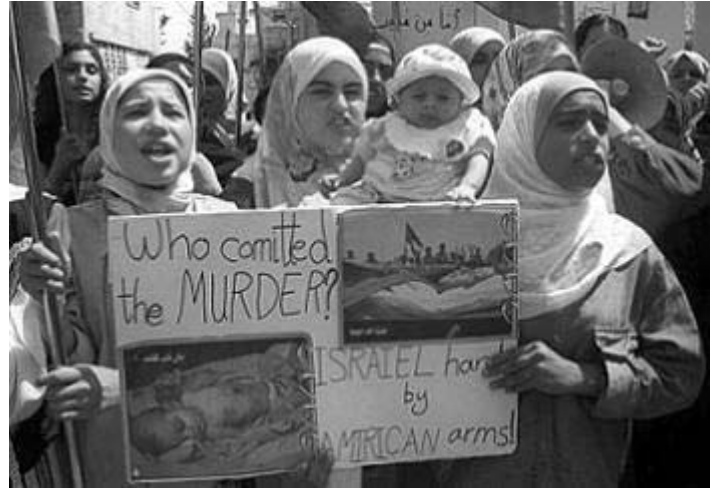
Hvem myrdede? Israelske hænder med Amerikanske våben