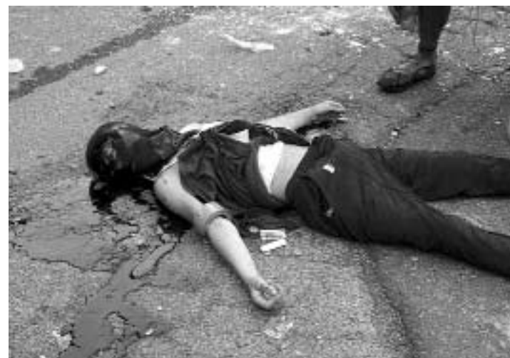
Carlo Giuliani blev myrdet af Italiensk Politi under en demonstration mod EU

Listen over enkeltpersoner domineres stadig af ETA-medlemmer eller sympatisører. Af 35 navne er 27 tilknyttet de baskiske separatister.