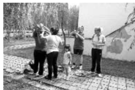
"Spice Girls" klar til turnering.

De personlige erfaringer fra deltagerne fra deres dagligdag, deres arbejde, deres børns virkelighed, tegnede et helt andet billede end det, der trækkes op i medierne: Det virkelige Danmark, med dets problemer, kampe og forhåbninger. Noget man ikke får andre steder – og som gør, vi kommer igen næste år.