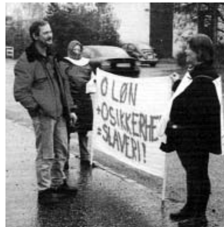
Fra "Slavekampagnen" mod tvangsaktivering under den socialdemokratiske Nyrup-regering

EU kræver nu, at de samme mennesker på overførselsindkomst føres tilba-