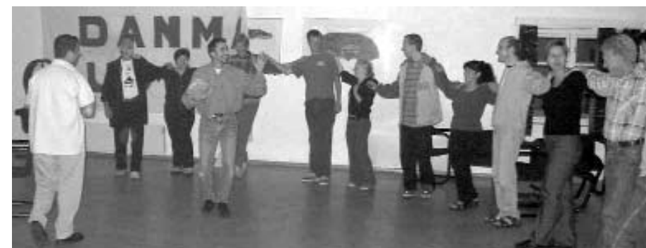
Kædedans på lejren.