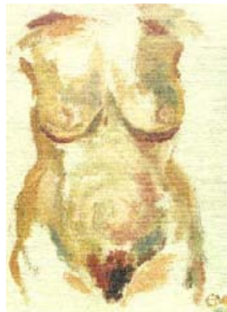
Evelyn Mittmann Kvindetorso, olie, 2002

Sommertid er festivaltid. Ferietid og forlystelsestid. Men det kan også være tid for kunst. Det er det f.eks. i Køge.