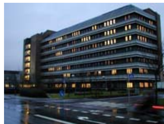
Hjørring-Brønderslev Sygehus Nogle hospitaler skal privatiseres - og Fogh-regeringen planlægger at gøre alle sygehuse til selvejende institutioner.

Den amtslige nedskæringsbølge til efteråret vil betyde lukningen af en lang række mindre sygehuse. En situation, som pengegriske private selskaber for længst har stillet sig i kø for at