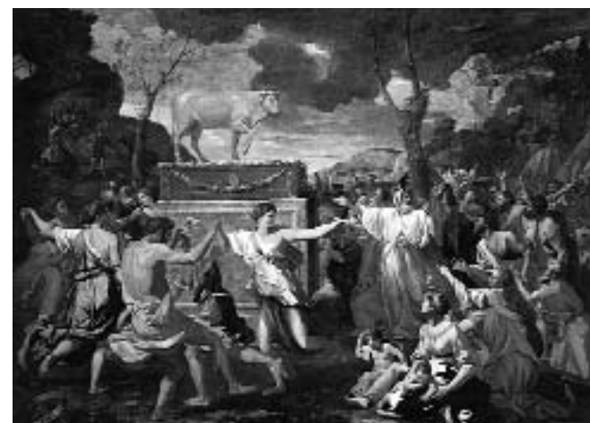
Poussin: Kapitalismen guddommeliggjort - eller Dansen om guldkalven