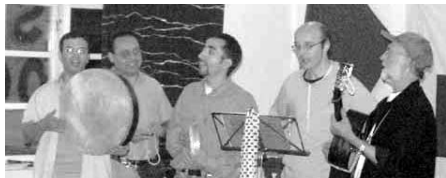
Palæstinensisk - Dansk kultursamarbejde

En uge på Bogense efterskole, nær vand, smuk natur, med herlige udflugtsmål som det ubeboede Æbelø: Rammerne kunne ikke være bedre for APKs sommerlejr (som delte den med DKU-lejren).