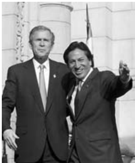
Koloniherre på inspektion: Bush og Perus præsident Toledo

Kammerater og venner i de forskellige folkelige og antiimperialistiske organisationer i Peru, der på denne 23. marts demonstrerer imod Plan Colombia og Det Panamerikanske Frihandelsområde (ALCA).