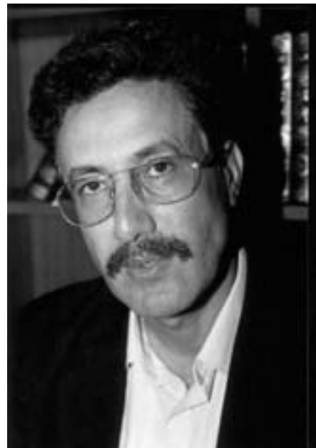
Hamma Hammami - politisk fange i Tunesien

Menneskerettighedsaktivister og progressive fagligt aktive og studerende – for slet ikke at tale om erklærede kommunister som dem i PCOT – forfølges, smides i fængsel og tortureres efter styrets forgodtbefindende. Ifølge Amnesty International er der i øjeblikket hen ved 1000 politiske fanger i Tunesiens fængsler.