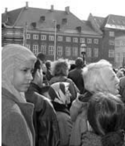
20. marts Christiansborg

Det skal ske gennem at presse endnu flere elever ind i klasserne, ikke mindst i de mindre skoler, så klassekvotienten sættes kraftigt i vejret. Udover klart forringede undervisningsmuligheder vil en bølge af nye skolelukninger blive konsekvensen af, at behandlingen af børn som burhøns skal fremmes yderli-