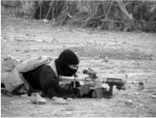
Amerikansk Navy Seal