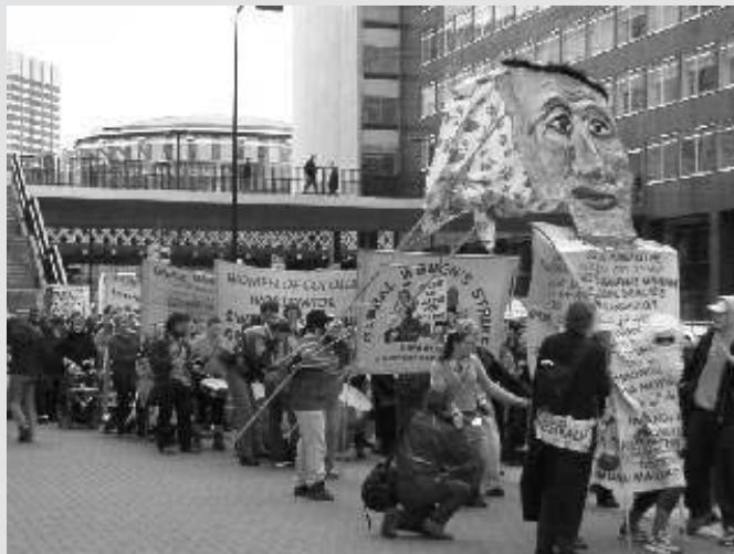
8. marts demonstrationen i London

Den internationale kvindestrejkes demo i London gik fra Shellbygningen forbi Downing Street og Forsvarsministeriet, før den sluttede med taler, rabalder og dans uden for Verdensbankens kontorer i Haymarket. Kvindestrejken markerede sig med aktioner i 80 lande.