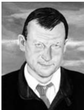
Hans ånd er der stadig

Det vil indgå i som det væsentligt led i regeringen Foghs såkaldte beskæftigelsesudspil kaldet "flere i arbejde", der på linie med integrationsudspillet vil tage sigte på at sikre arbejdsgiverne rigelig med ekstremt billig arbejdskraft uden faglige rettigheder, der kan udnyttes som løntrykke-