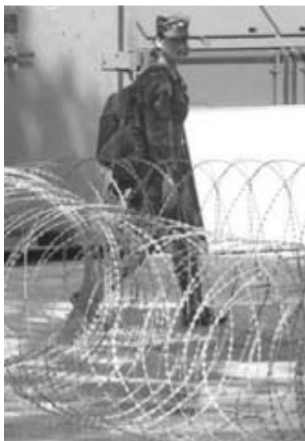
For første gang siden 1991 er amerikanske tropper på plads i filippinerne

I første omgang forventes USA at sende 1200 specialstyrker og instruktører for at 'uddanne, vejlede og hjælpe' de filippinske regeringsstyrker, der er involveret i en borgerkrig på en række forskellige fronter. Dels mod forskellige selvstændighedsbevægelser, dels mod den kommunistisk ledte befrielseshær New Peoples' Army, der har ført en langvarig folkekrig siden den tog kampen op mod Marcos-diktaturet. Arroyo-regeringen har udtrykkeligt erklæret, at den opfatter New Peoples' Army og Den Nationale Demokratiske Front,