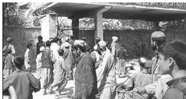
Afghanere angriber den forladte amerikanske ambassade i Kabul, september 2001

re jagt på Osama bin Laden og Al Qaeda. Ikke bare amerikanske, men også allierede specialenheder fra Tyrkiet, Storbritannien og Tyskland deltager nu i disse operationer. Ifølge Pentagon styrkede en transporthelikopter ned i sidste uge med dræbte amerikanere til følge. Den blev skudt ned.