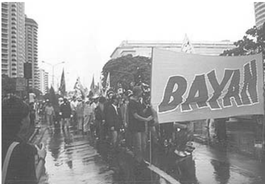
USA sender igen sine tropper til Filippinerne - amerikansk koloni i næsten 100 år.