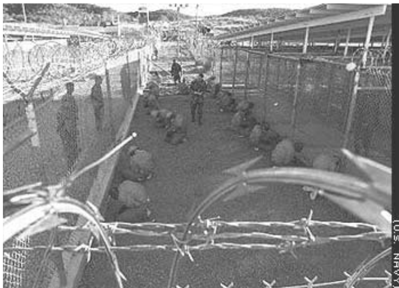
Fremvisning af krigsfanger: Et moderne romersk triumftog.

Det er reelt af mindre betydning, hvorvidt det er krigsfanger eller ej. Fanger-