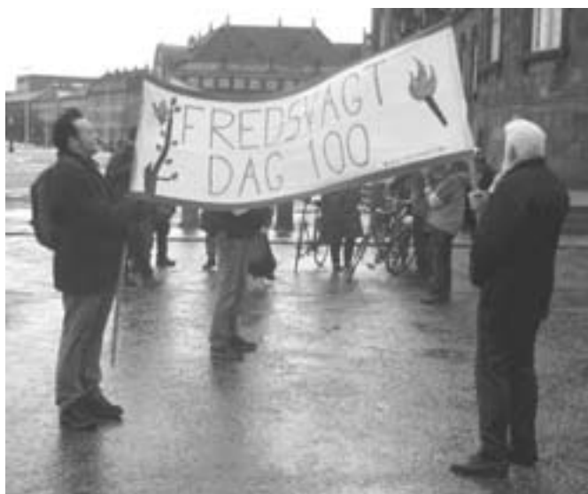
F r e d s v a g t dag 100