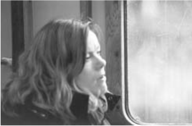
På vej ud?

VK-regeringens beskæftigelsesminister Claus Hjort Frederiksen (V) vil med lovindgreb i overenskomsterne give arbejdsgiverne fuld frihed for til indføre tvungen deltid, hvor og hvornår det passer dem. Arbejdsgiverne skal fremover kunne diktere deltid gennem individuelle aftaler. Den såkaldte sicilianske model: Enten makker du ret, eller også er du fyret.