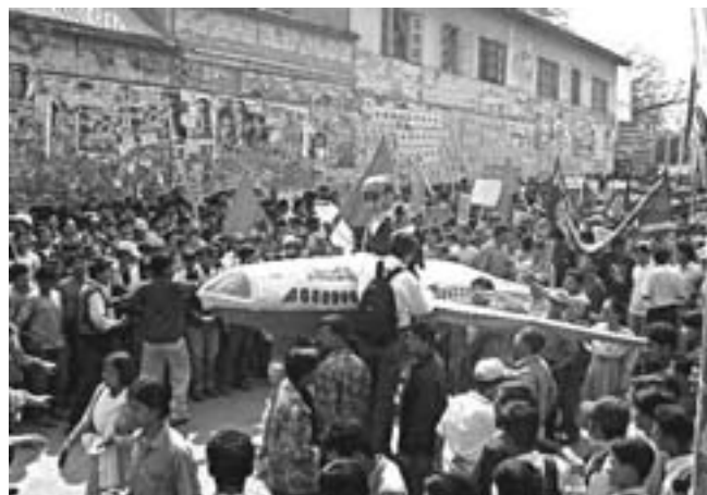
Demonstration i Katmandu

Fredsforhandlingerne strandede således på spørgsmålet om republik, dannelse af en overgangsregering og indkaldelse af en forfatningsgivende forsamling. Onsdag erklærede Prachanda i en pressemeddelelse efter regeringens afvisning af at inddrage spørgsmålet om republikken, at fredsforhandlingerne var slået fejl som føl-