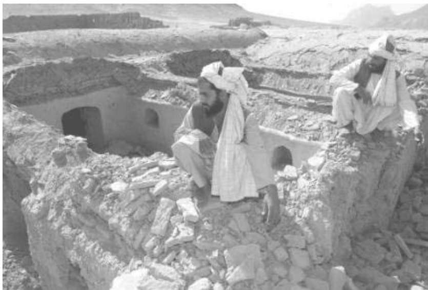
Afghanerne er kommet fra asken i ilden med Nordalliancens magtovertagelse.

Det er samtidig en kendsgerning, at talibanernes undertrykkende forbud og påtvungne ritualer, der begrundes religiøst, er og har været upopulære i store