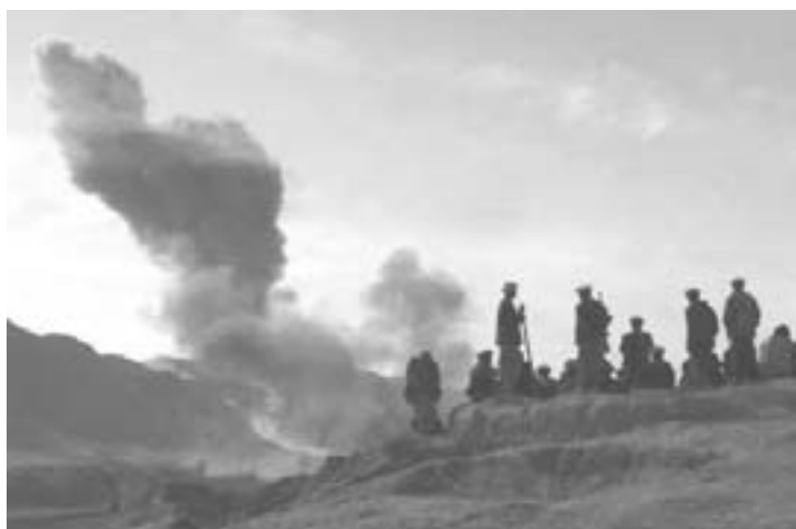
Amerikanske tæppebombninger af Kunduz skal bane vej for Nordalliansens indtog.

mennesker. Tortur er almindelig i Guatemala, hvor militær og politi bliver sendt til skoler i USA for at lære bødleres teknikker.