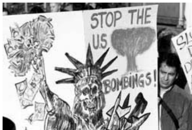
Fra fredsdemonstration i Stockholm

på gang gennem de vestlige politikere, at de kun ønsker at bombe militære mål i Afghanistan.