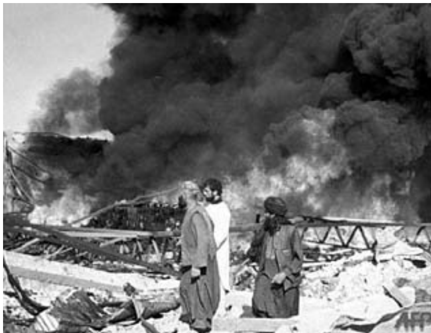
Brændende Røde Kors bygning i Kabul

I mellemtiden har USA smidt 37.000 pakker med fødevarer ned fra fly. Prøv selv at regne efter. Det rækker