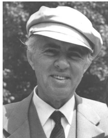
Enver Hoxha - afslørede "Prag-foråret" og sovjetledelsen.

'De sovjetiske revisionister', skrev han videre, 'vil aldrig gå med til den