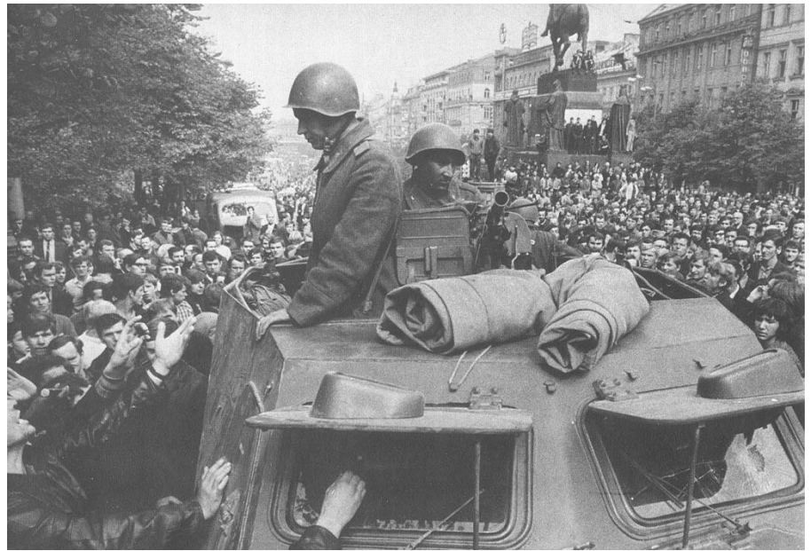
Russisk tank i prag, 21. august 1968

'Den store krise i de moderne revisionisters lejr bekræftes og vokser sig dybere for hvert år. Alle disse begivenheder og alle dem, der nødvendigvis må følge i fremtiden, som vil blive endnu mere katastrofale for revisionisterne, er et resultat og en konsekvens af deres forræderi mod marxismen-leninismen, af den kapitalistiske vej, de er slået ind på i ideologi, politik og økonomi, i organiseringen af partiet, staten og økonomien.