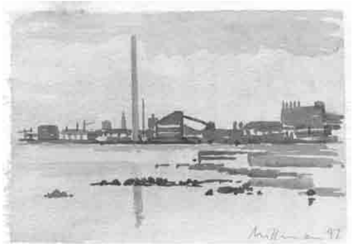
Tuborgskorstenen, set fra Charlottenlund Fort, 1997

R i 1964. ademi, Dresden. mi, Berlin. Maleri og fik. ger bl.a. i Berlin, og København. den 1972, bl.a. i Karl , Dresden, Rostock eder i Danmark. å Kunstnernes ng på Den Frie. d værker i 22 lande. s Kunstnerleksikon