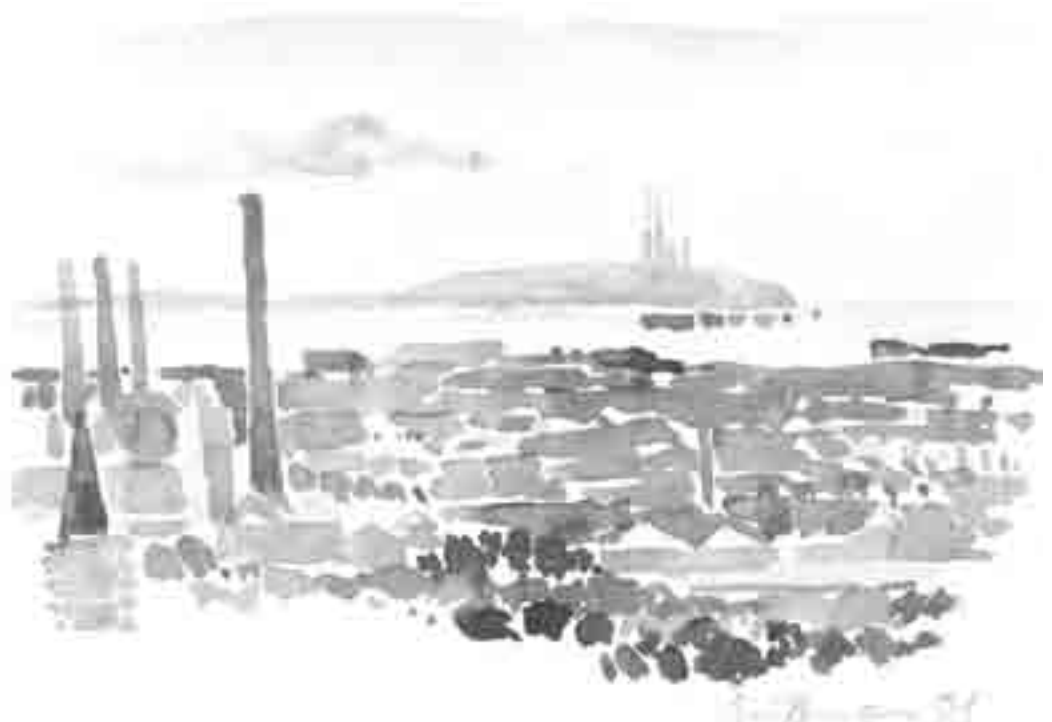
Øresundsbroen set fra Domus Vista, 2001