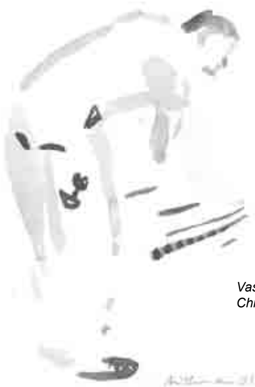
Vaskemaskinemontør på Christian Hansens fabrik, 2001