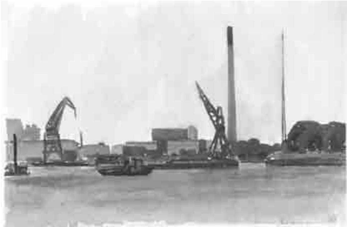
Blik mod B&W fra Langelinie, 1988