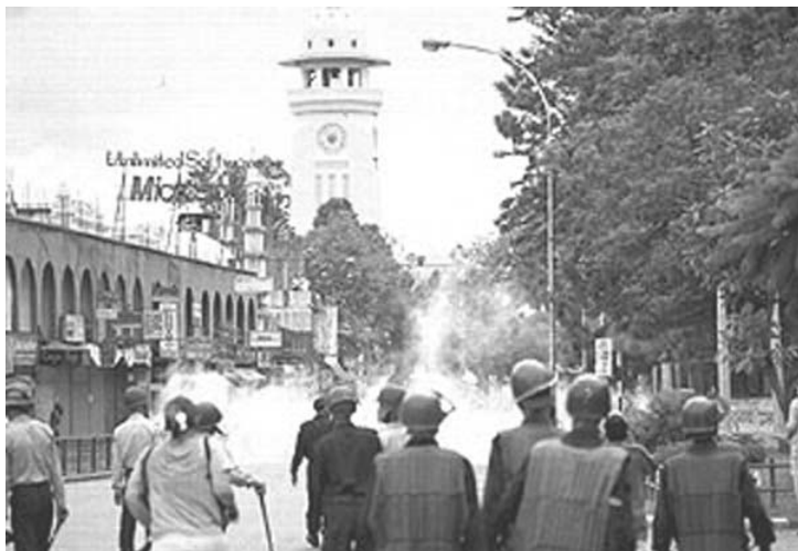
Politiet angriber demonstranter i Nepals hovedstad Kathmandu