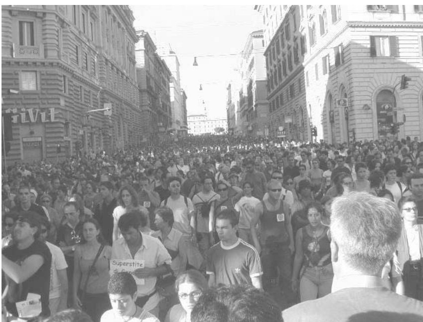
50.000 demonstrerede i Rom mod politivold - og til minde om den myrdede Carlo Giuliani

Indenrigsminister Claudio Scajola (Forza Italia), som bærer det politiske hovedansvar for politiistatsmetoderne, forsvarede i det italienske parlament voldsindsatsen: