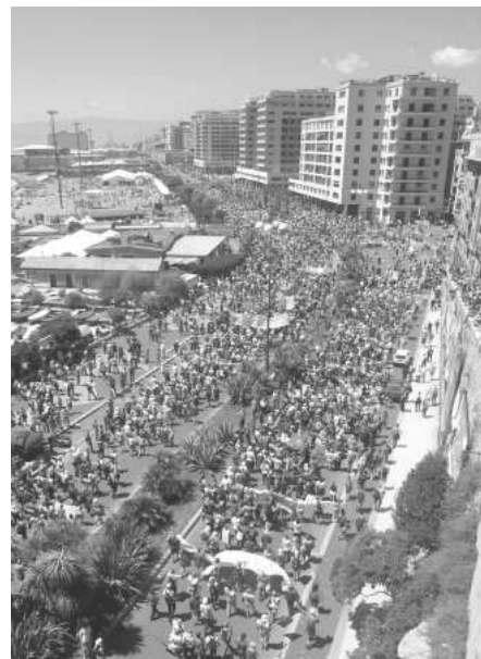
Politivold og fascistiske provokatører kunne ikke skræmme folk væk. Lørdag gik 150.000 i demonstration gennem Genova.

De italienske myndigheder har officielt meddelt, at godt 500 er blevet