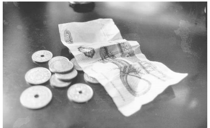
Indbyrdes kamp mellem de ansatte, om en beskeden lønpulje, skal erstatte den fælles lønkamp mod arbejdsgiverne.