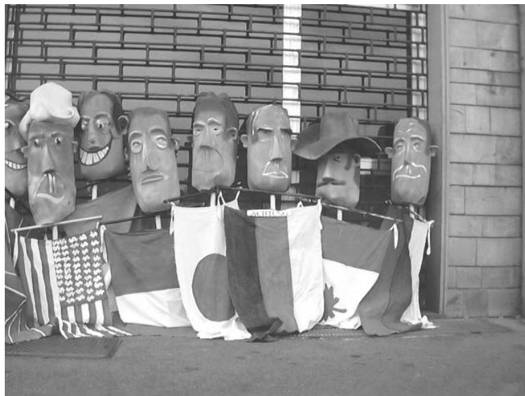
De 8 store.

Walden Bello er professor i sociologi og offentlig forvaltning og direktør for Institutet Focus on the Global South med hovedsæde i Bangkok.