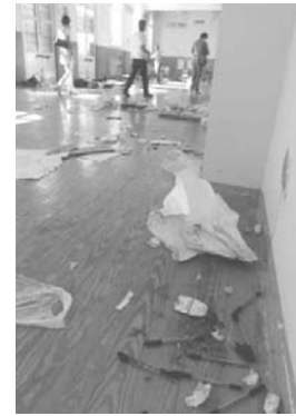
Det uafhængige mediecenter efter politiets razia. Computere, papirer, film og kameraer er enten konfiskeret eller ødelagt.

Hele søndagen fortsatte politiet med at prygle aktivister rundt om i Genova, både på gader og i fængsler. Mange